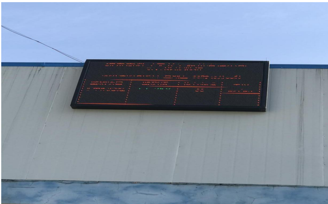
废气（非甲烷总烃）在线监测