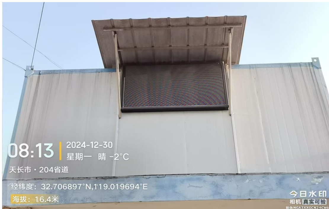
废水在线监测（已报停）